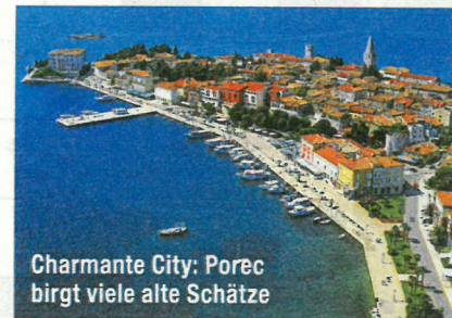
Charmante City: Porec birgt viele alte Schätze

unweit von trüffelreichen Feldern ist es aber auch ein Ziel für kulinarische Exkursionen und Einkaufsbummel. Gut, dass die mediterrane Region auf karstigem Boden vielfältige Natur-