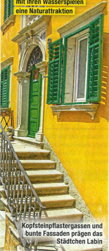
Kopfsteinpflastergassen und bunte Fassaden prägen das Städtchen Labin