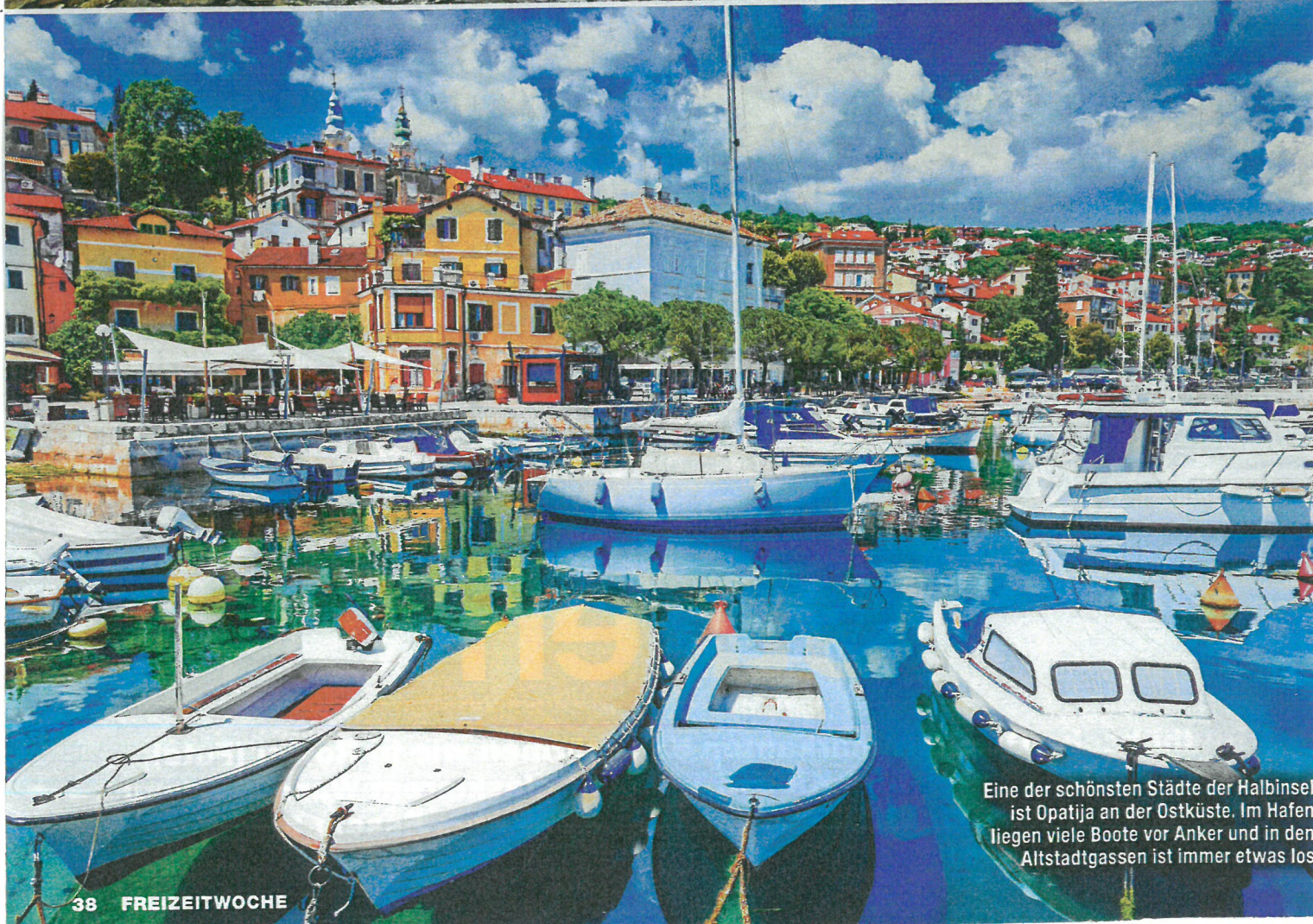
Eine der schönsten Städte der Halbinsel ist Opatija an der Ostküste. Im Hafen liegen viele Boote vor Anker und in den Altstadtgassen ist immer etwas los