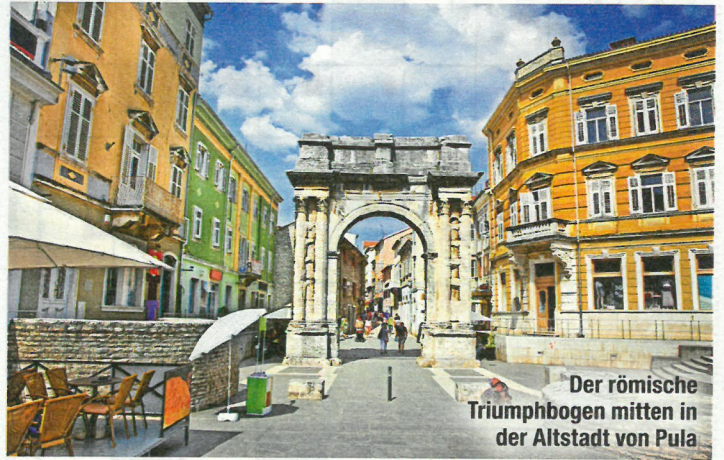
Der römische Triumphbogen mitten in der Altstadt von Pula

Auf der Westseite haben vor allem die Römer die Orte geprägt. Denn nur die Adria trennt sie von Italien. In der Hafenstadt Pula etwa steht eines der größten und besterhaltenen Amphitheater der Antike. Und die Struktur der