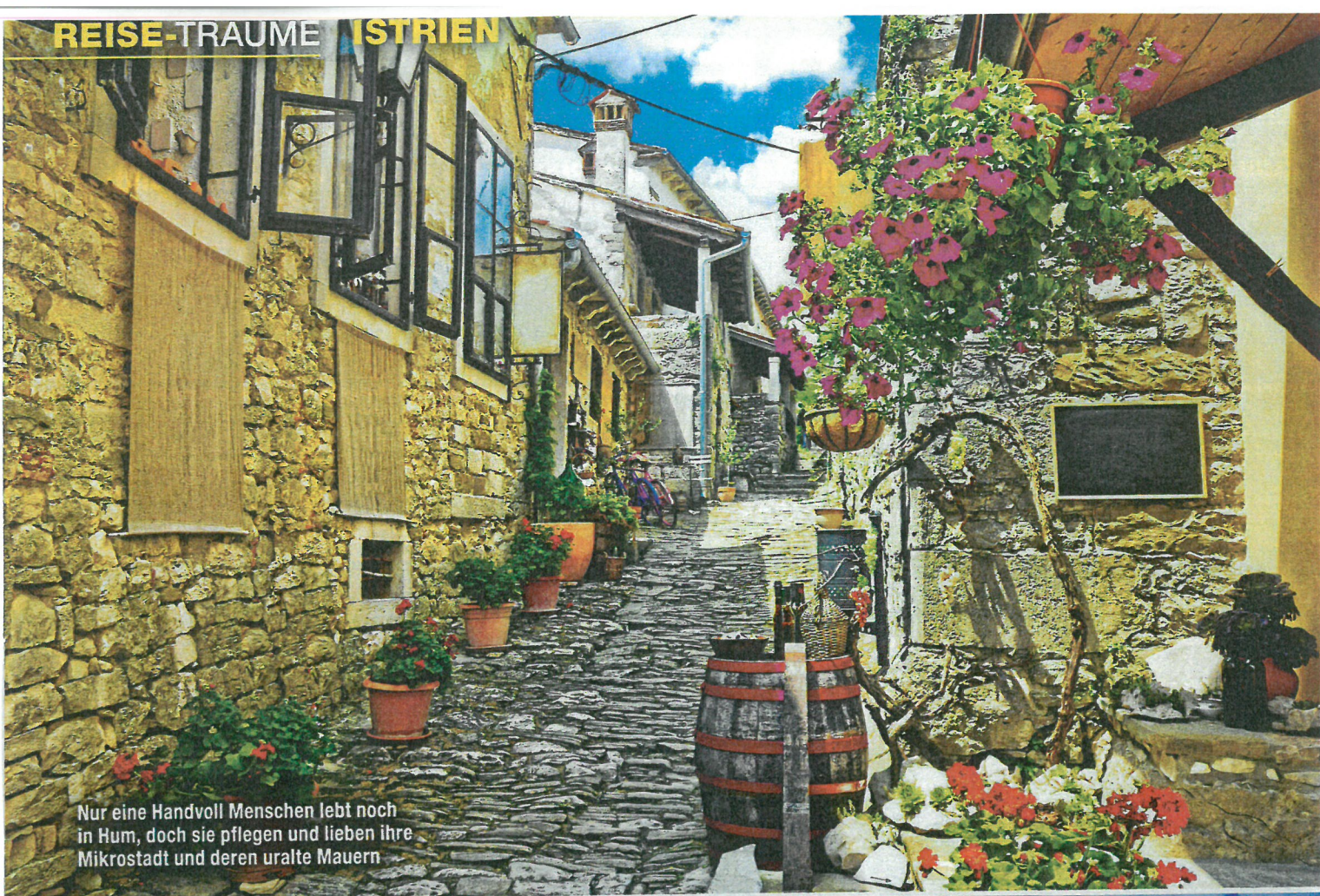
Nur eine Handvoll Menschen lebt noch in Hum, doch sie pflegen und lieben ihre Mikrostadt und deren uralte Mauern