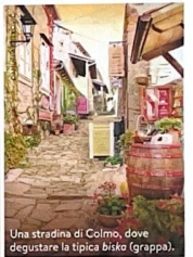
Una stradina di Colmo, dove degustare la tipica bisko (grappa).

LA FORESTA DI MONTONA con le paludi, le querce e i tartufi bianchi, i filari di Terrano e il fiume Quieto , antica via commerciale tra l'entroterra e il mar Adriatico, fin dall'Impero Romano. In Istria , la regione più occidentale della Croazia, si viaggia di colle in colle, tra borghi medievali arroccati che dominano un entroterra dipinto di verde. L'itinerario più scenografico tocca Montona , cinta da possenti mura e con le strade in pietra, Piemonte d'Istria e il suo campanile pendente, l'ex città-fortezza di Portole che custodisce palazzi e portali veneziani, e la minuscola Colmo , la città più piccola del mondo con le sue casette in miniatura.