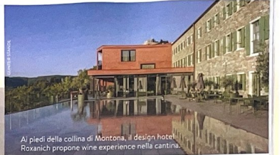
Al piedi della collina di Montona, il design hotel Rovanič propone wine experience nella cantina.