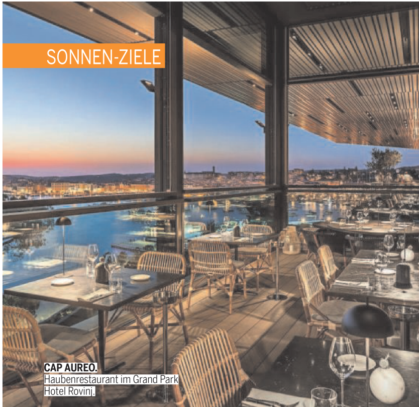
CAP AUREO. Haubenrestaurant im Grand Park Hotel Rovinj.