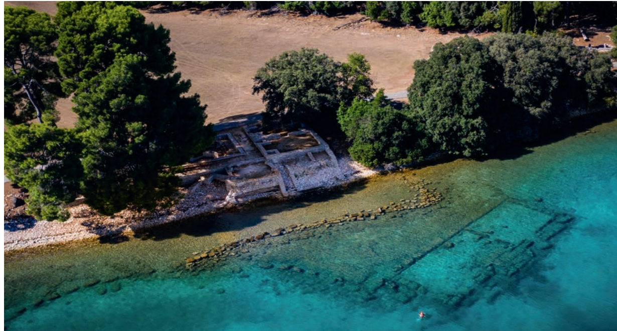
An der Küste der Brijuni-Inseln führt ein 500 Meter langer Schnorchelpfad durch die Verige-Bucht über römische Ruinen.