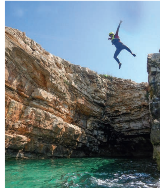
Nervenkitzel pur: In voller Montur geht es beim Klippenspringen am Kap Kamenjak bis zu acht Meter in die Tiefe.

Unweit von Poreč wartet mit der Karsthöhle Baredine ein geomorphologisches Naturdenkmal erster Güte – und auf Besucher eine Entscheidung: Entweder schließen sie sich den Guides an, die ihre Gruppe durch fünf beeindruckende Tropfsteinsektionen 60 Meter in die Tiefe führen; oder sie schreiben sich im Speleo-Climbing-Zentrum ein, um von Profis in einer benachbarten Höhlengrube Techniken des Hoch- und Hinunterkletterns am Seil gezeigt zu bekommen. Noch erlebnisintensiver sind dann länger andauernde und auf Anfrage organisierte Höhlentouren unter Tage. Mehr Informationen: baredine.com , speleolit.com .