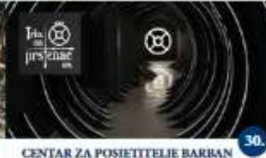
CENTAR ZA POSJETITELJE BARRAN - MULTIMEDIJALNI CENTAR BARRAN - MUZEJ TRKE NA PRSTINAC Samostalno i vodeno razgledavanje Visita individuale e guidata