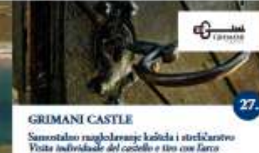
GRIMANI CASTLE Samostalno razgledavanje kaštila i streljarstvo Visita individuale del castello e tiro con arco Escape Castle i streljarstvo / tiro con arco Kuća vjebice Mare - virtuale streljarstvo i Lov na baliznu Casa della strega Mare - tiro con arco virtuale e Caccia al tesoro