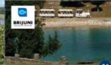
NACIONALNI PARK BRIJUNI Islet "Voški ljepon" Gila "Briner maggiore"