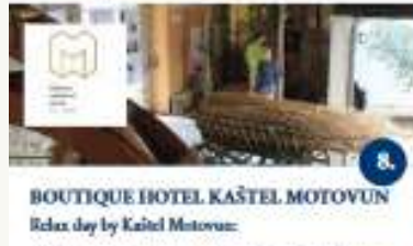
BOUTIQUE HOTEL KAŠTEL MOTOVUN Relax day by Kaštel Motovun Wellness basen i sauna uzina i desert u restoranu sa kavom i samostalno obilazak Kulturno-educativnog centra Wellness piscina e sauna usci e desert nel ristorante con caffè - visita individuale del Centro culturale educativo