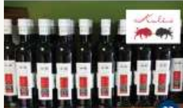
OPG ZORAN KALČIĆ Degustacija 4 ulja, 6 rakija i 3 vina Degustazione di 4 oli d'oliva, 6 grappe e 3 vini