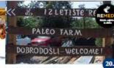
REMEDY IZLETISTE I PALEO FARMA Obilazak farme, kuhanje vlastitih proizvoda Visita della fattoria, degustazione di prodotti propri