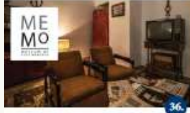
MEMO MUZEJ Projekt muzeja Visita del museo