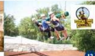
ADRENALIN PARK KRINGA Koristite svih staza Utilizzo di tutti i percorsi