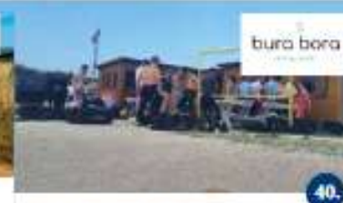
DIVING NETWORK D.O.O. Discovery dive Primo scorpse / Immersione di prova