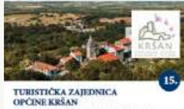
TURISTIČKA ZAJEDNICA OPĆINE KRŠAN Interaktivna radionica "Tradicionalna bučnica i obiteljno poduzetništvo u kulturnom turizmu" / Workshop interattivo "Patrimonio culturale e imprenditoria familiare nel turismo culturale" Pradunat / Carato dei disc. Romana Lekt