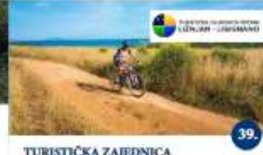
TURISTIČKA ZAJEDNICA OPĆINE LIŽNJAN Zmajica ruta na dva kotača Percorso dei draghi a due ruote