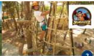
ADVENTURE PARK JANGALOOZ Koristite svih klasa i transporta Utilizzo di tutti i percorsi e del trasporto