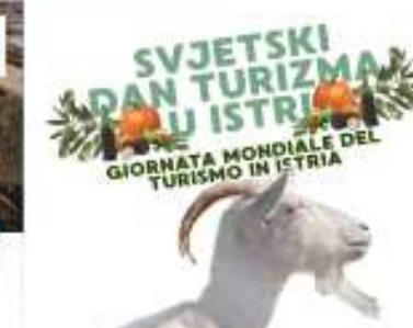
SVJETSKI DAN TURIZMA U ISTRI GIORNATA MONDIALE DEL TURISMO IN ISTRIA