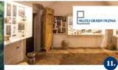
MUZEJ GRADA PAZINA / MUSEO DI PISINO Projekt muzeja Visita del museo