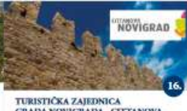
TURISTIČKA ZAJEDNICA GRADA NOVIGRADA - CITTANOVA Explore Novigrad Vodeni razgled grada Visita guidata della città