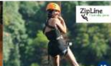
ZIPLINE PAZINSKA JAMA Spuštanje zip-linom Discesa sul zip-line