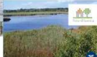
JAVNA USTANOVA NATURA HISTRICA Posjet Posebnom ornitološkom rezervatu Palud Visita della riserva ornitologica speciale Palud