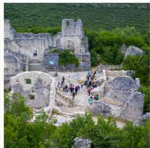
Dvigrad storytelling tour | Istra Inspirit

Istra Inspirit 6. kolovoza · 🌐 Obavještavamo vas, da su sva mjesta za Dvigrad Storytelling Tour, 8.08. popunjena! 😊 Hvala vam na lijepom odazivu, koji nas veseli i potiče da i dalje oživljavamo priče, mitove i legende čarobnog poluotoka. 😊