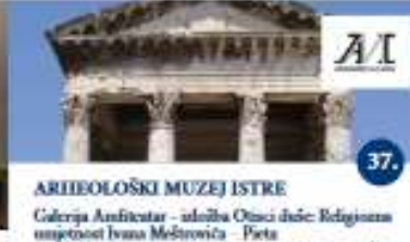
ARHEOLOŠKI MUZEJ ISTRE Galerija Amfiteatar - udružba Otisci duće: Religiozna umjetnost Ivana Meštrovića - Pula Galleria Anfiteatro - mostra Impresio dell'antico: Larte religiosa di Ivan Meštrović - Pola Augustus Heram / Il Tempio di Augusto Galleria C8 Idolista / Galleria C8 mostra Abscondita