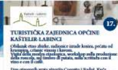
TURISTIČKA ZAJEDNICA OPĆINE KAŠTELER LABINCI Obilazak etno zgrade, radionice izrade kosti, pečata od kruševca, crtanje vinom i kavom. Visita della mostra etnologica, workshop sulla produzione della rosalia, un'attività di pasta, sala scottata con il vino e con il caffè. Day etno-culture visita vinaria Cosetto i Radici, Kupa peča OPG Veritas, Degustacija jela Kaštelerkih konoba i degustacija tipičnih lokalca OPG Veritas. Celebrati JED: cantine vino-ore: Cosetto e Radici, Cupa del miele OPG Veritas, Degustazione delle specialità delle cantine di Cosetto e degustazione dei dolci tipici dell'OPG Veritas.