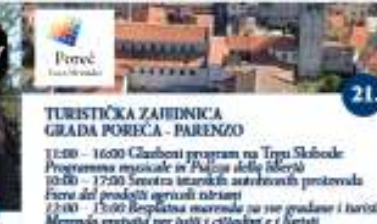
TURISTIČKA ZAJEDNICA GRADA POREČA - PARENZO 11:00 - 16:00 Glazbeni program na Trgu Skrbode Programma musicale in Piazza della Sclerda 10:00 - 17:00 Smetra izložba austrijskih protestova Fiera del produtt agricoli italiani 17:00 - 19:00 Ispletina macedna sa svo gradone i barite Mensala gratuita per tutti e cittadini e turisti 13:00 - 15:20 Dječja nagrada "Dječja letina" Associazione dei premi "vecce della farfalle" 17:00 - 18:00 Ispletina odinal goro razgledavanje grada e pranje vode "Uposni Pore" (obavijena rajava) Visita guidata gratuita della città "Conosci Parenzo" (produzione obbligatoria)