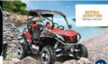
ISTRA ADVENTURE QUAD Safari BUGGY Safari