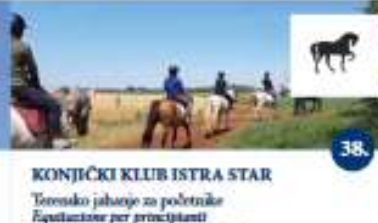
KONJIČKI KLUB ISTRA STAR Terensko jahanje za početnike Equitazione per principianti Terensko jahanje sa skakom jahanje Equitazione per esperti Jahanje (vodeno) sa djeca Equitazione per bambini (con guida)