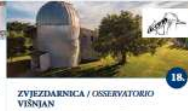
ZVJEZDARNICA / OSSERVATORIO VIŠNJAN Predavanje na temu iz astronomije Presentazione sull'astronomia Presentazione teleskopik tipa teleskop Osservazione dei corpi celesti con il telescopio