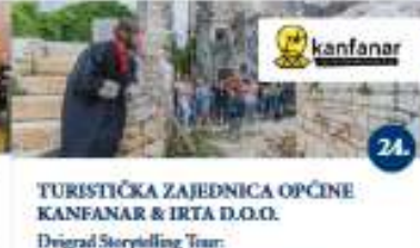
TURISTIČKA ZAJEDNICA OPĆINE KANFANAR & IRTVA D.O.O. Drigrad Storytelling Tour Interaktivna letnja Drigradom u izvedbi Istra Inspira Passeggiata interattiva per Drigradoli eseguita da Istra Inspira