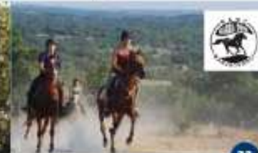
RANCH BARRA TONE Rekreativno jahanje Equitazione ricreativa