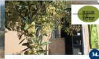
KUĆA ISTARSKOG MASLINOVOG ULJA Projekt muzeja Visita del museo