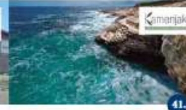
JAVNA USTANOVA KAMENJAK Edukativna letnja sa stručnim vodjenjem Passeggiata educativa con guida