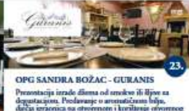
OPG SANDRA BOŽAC - GURANIŠ Presentazione irade diema od svrlovo il ilve za degustazione. Poslužanje u aromatizirano bilje, divlja igračica na otvorenom i korištenje otvorenog bazena. Presentazione della produzione della marmellata di fichi e di prughe con degustazione. Lezione sulle piante aromatiche, laboratorio per bambini e utilizzo della piscina esterna.