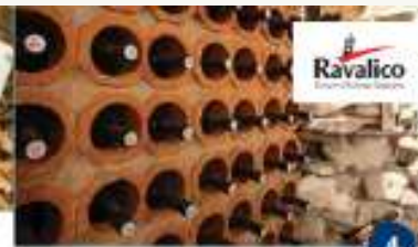
ZO F & F RAVALICO VINARSTVO Razgledavanje vinarije s degustacijom Visita della cantina con degustazione