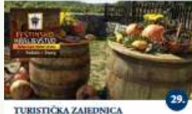
TURISTIČKA ZAJEDNICA OPĆINE ŽMINJ - ŠPIJLA FESTINSKO KRALJEVSTVO Vodeni obilazak špilje Visita guidata della grotta