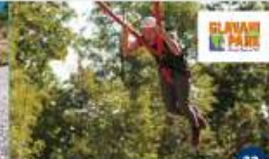
GLAVANI PARK Koristite svih staza i katapulta Utilizzo di tutti i percorsi e della catapulta