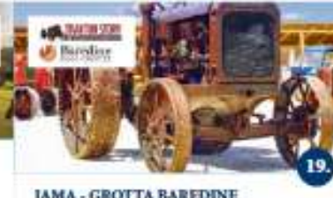
JAMA - GROTTA BAREDINE & TRAKTOR STORY Obilazak jame Baredine i izložbe starih traktora Visita della grotta Baredine e della mostra di trattori d'epoca