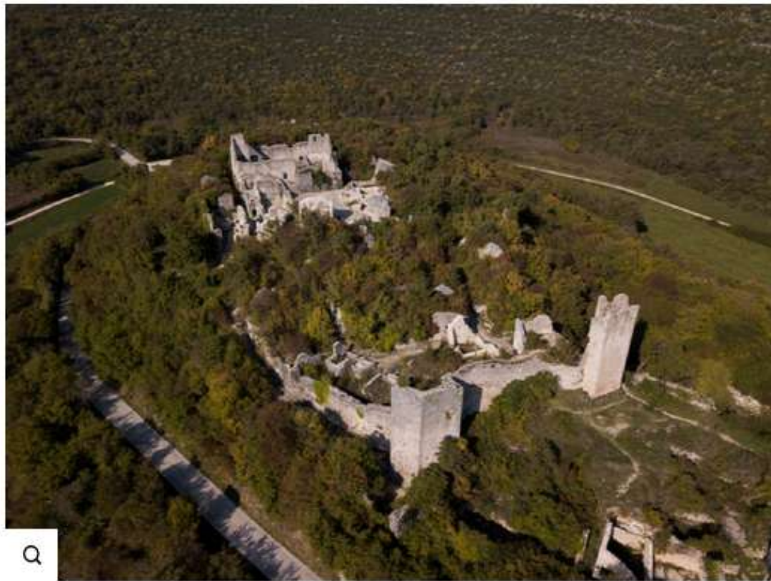
Dvigrad a magasból

Izgalmas történelmi sétákat vezettek be Európa egyik legnagyobb romvárosában. A horvát Dvigradon beöltözött mesélők várják a turistákat, akik a hely régi történeteit és legendáit mesélik el szórakoztató módon.