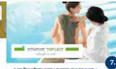
IJČIŠTE ISTARSKE TOPLICE / TERME DI S. STEFANO Kupanje u termalnom bazenu, medicinska masaža Utilizzo della piscina termale, massaggio medicinale