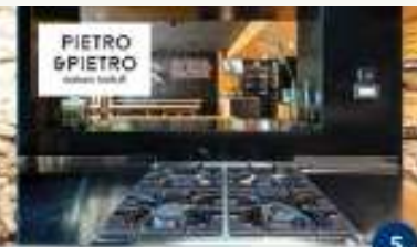
NATURA D.O.O. Degustacija proizvoda s tartufima Degustazione di prodotti con tartufi