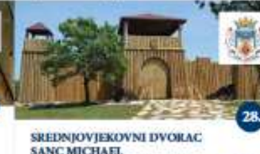
SREDNJOVJEKOVNI DVORAC SANC MICHAELI Streljarstvo, jahanje ponija, vjebica košijom, vrtja u vrtuljku, mačevanje u vitazone, labirint Tiro con arco, Pony da cavalcare, giro in carretta, carovella, duello a spada con un cavaliere, labirinto