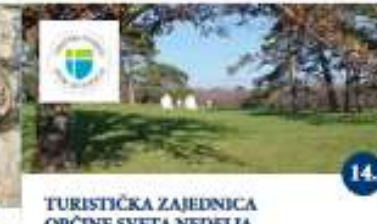
TURISTIČKA ZAJEDNICA OPĆINE SVETA NEDELJA Edukativna letnja sa stručnim vodjenjem kroz Park skulptura Dalmeza Passeggiata educativa guidata nel parco delle sculture di Dalmeza