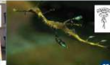
AQUARIUM PULA d.o.o. Projekt akvarija Entrata nell'acquario