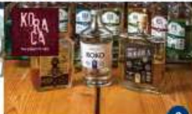
OPG KORACA - DESTILERIJA Degustacija likerova Degustazione di liquori