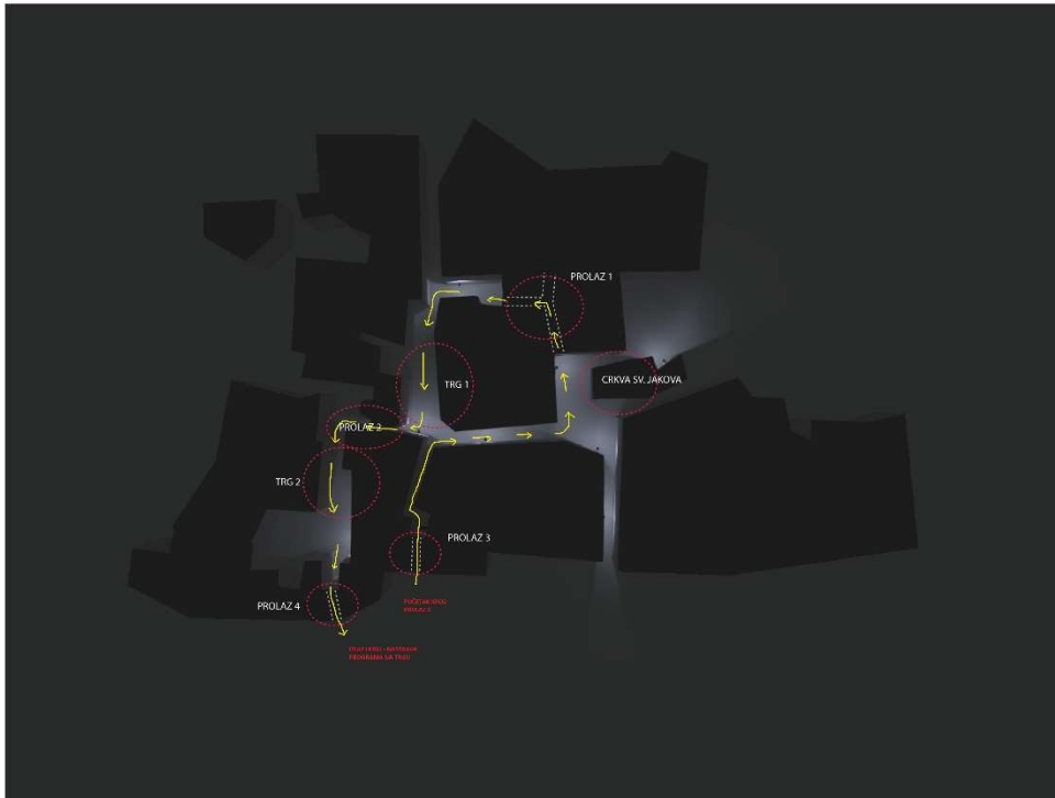
PROLAZI KROZ VRIJEME U SLIKAMA: