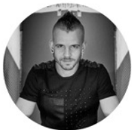
CHEF Dabiz Munoz

DiverXO, 3*** Michelinove zvezdice Spanjolska