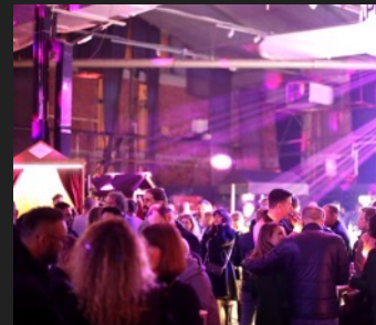
NETWORKING & ZABAVA UZ VIŠE OD 2000 POSJETITELJA