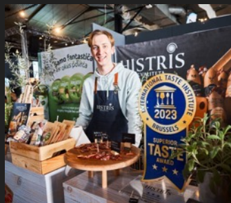
IZLOŽBENA ZONA S VIŠE OD 80 IZLAGAČA