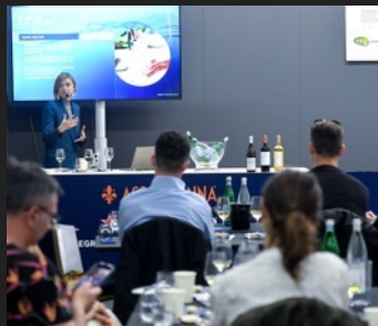
MASTERCLASSOVI WINE, GASTRO, MIXOLOGY