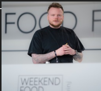
PREDAVANJA I PANELI O NAJVAŽNIJIM TEMAMA I IZAZOVIMA