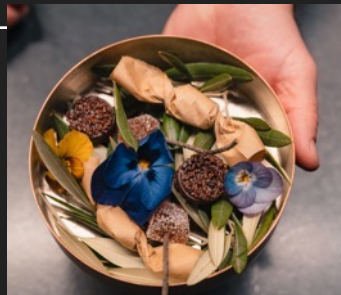
GALA VEČERE SVJETSKIH I DOMAĆIH CHEFOVA