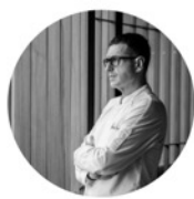
CHEF Ricard Camarena

Ricard Camarena Restaurant, 2** Michelinove zvezdice, Green star Spanjolska