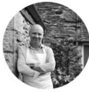
CHEF Simon Rogan

Hiša Franko 2** Michelin zvezdice, Green star Slovenija