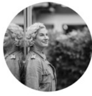
CHEF Ana Roš

Hiša Franko 2** Michelin zvezdice, Green star Slovenija