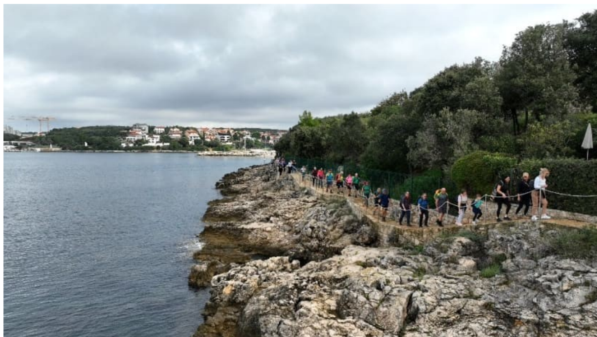
Slika 10: S pješaćenja na Camino Family u Pješćanoj uvali