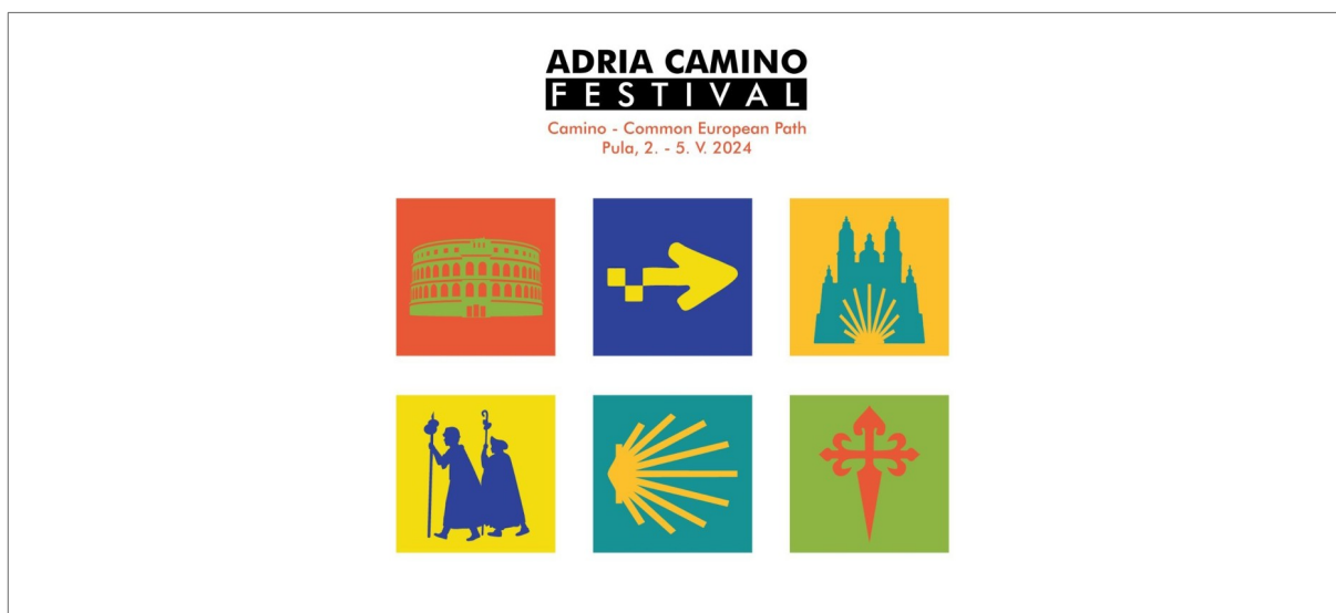
Slika 3: Vizual Adria Camino Festivala