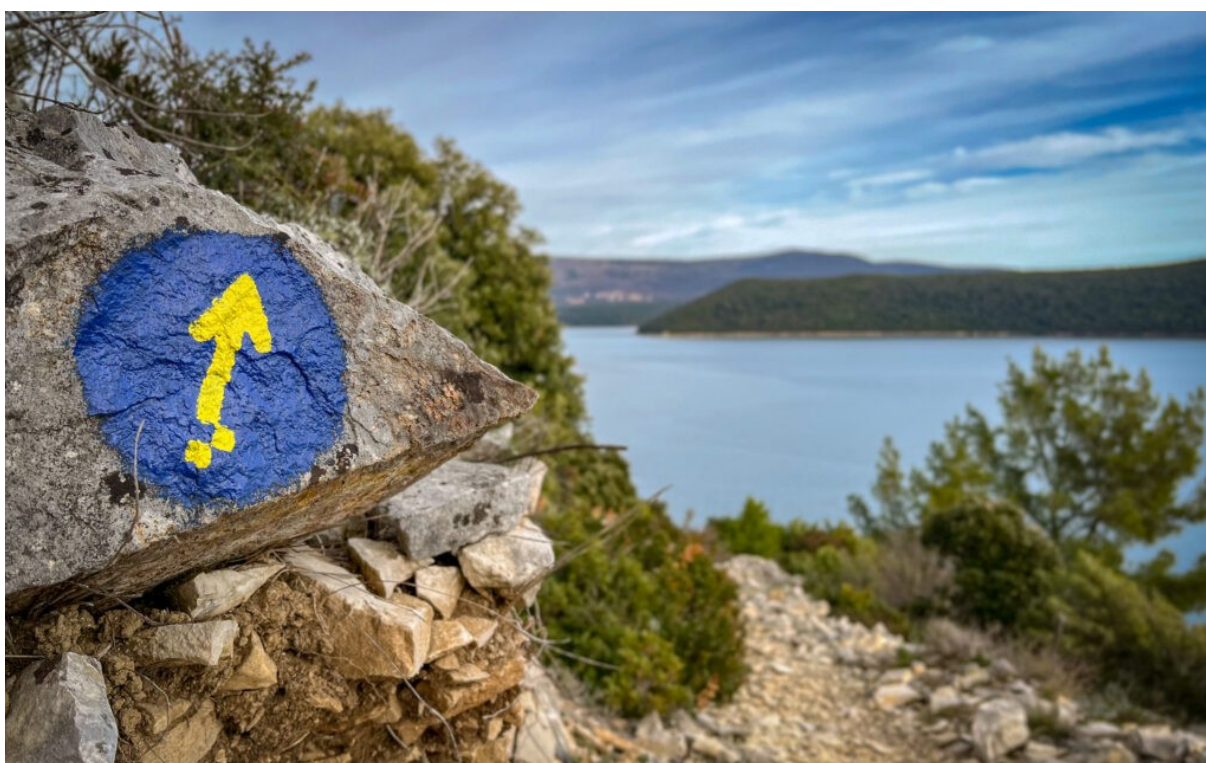
Slika 2: Označena staza Camino South Istria