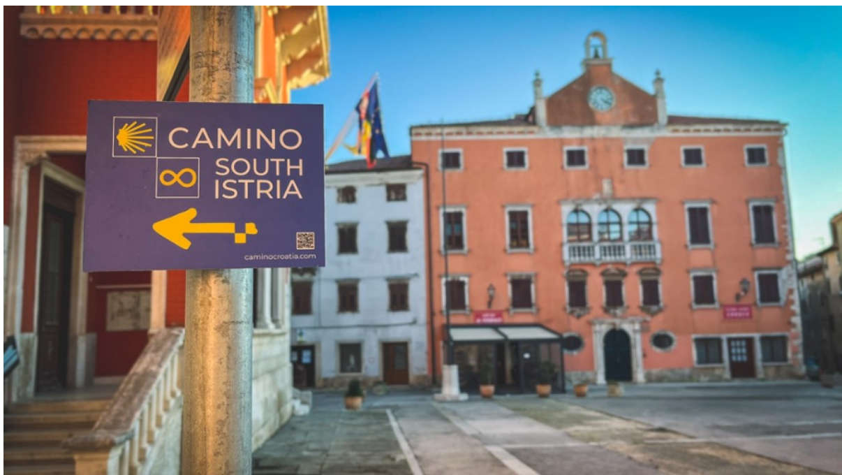
Slika 1: Označena staza Camino South Istria