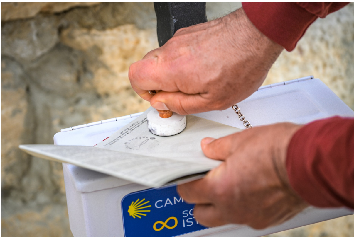
Slika 7: Jedan od 18 pečata na stazi