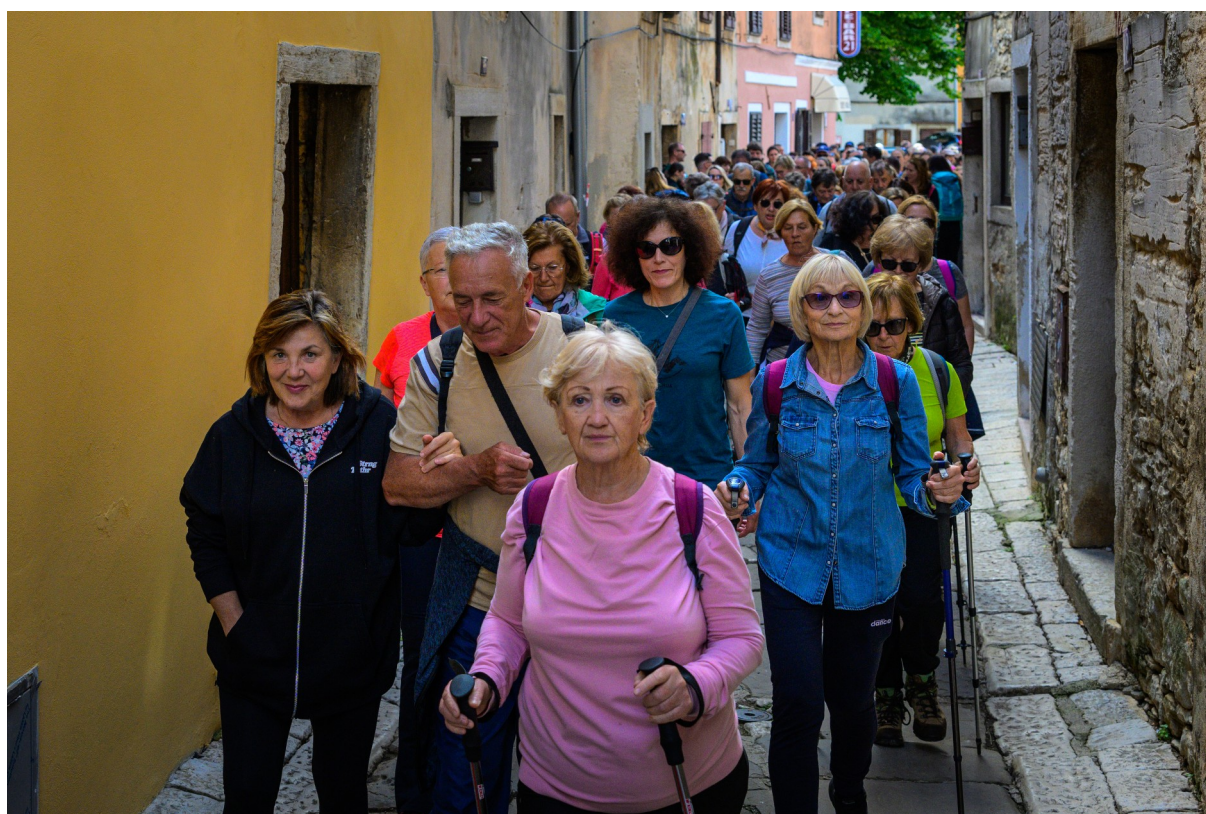
Slika 4: Otvorenje Camino staze u Vodnjanu