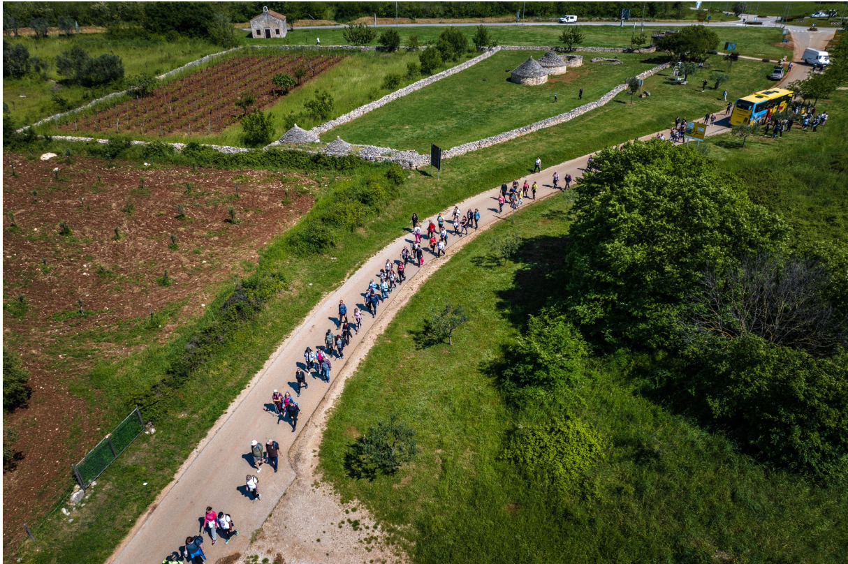
Slika 5: S otvorenja Camino staze u Vodnjanu