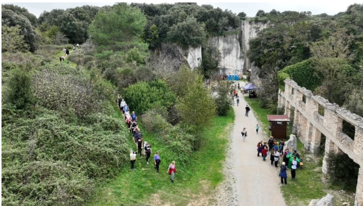
Slika 11: Camino Family završetak u kamenolomu Cave Romane