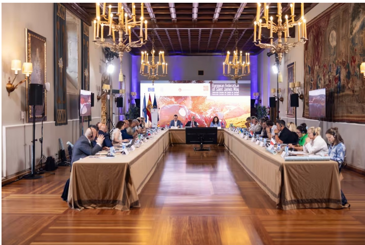
Slika 8: Europska federacija Puta sv. Jakova