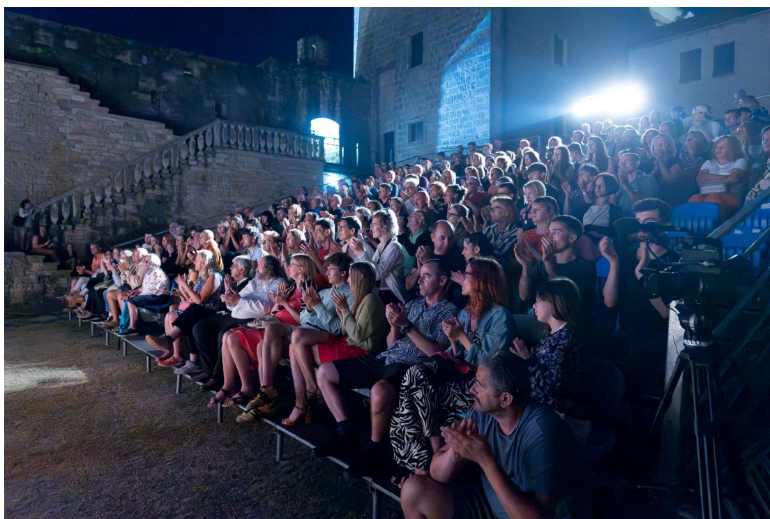
(publika 25. festivala)

Ove godine, festival se ponovno afirmirao kao cijenjena platforma za plesne umjetnike, ljubitelje kazališta i znatiželjne turiste, te nastavio svoju, već, dugogodišnju tradiciju okupljanja istaknutih predstavnika Hrvatske i inozemne plesne scene. Tijekom dva i pol desetljeća svog postojanja, festival je organizirao preko 350 različitih programa renomiranih umjetničkih kolektiva s raznolikim i unikatnim autorskim potpisima. Publika je svjedočila izvedbama različitih žanrova i stilova, od suvremenog plesa do performansa, cirkuserija i uličnog teatra, te čestim edukativnim radionicama. Sve gostujuće inozemne predstave uvijek su ujedno bile i hrvatske premijere, čime je festival stekao neizostavan status ekskluzivnosti.