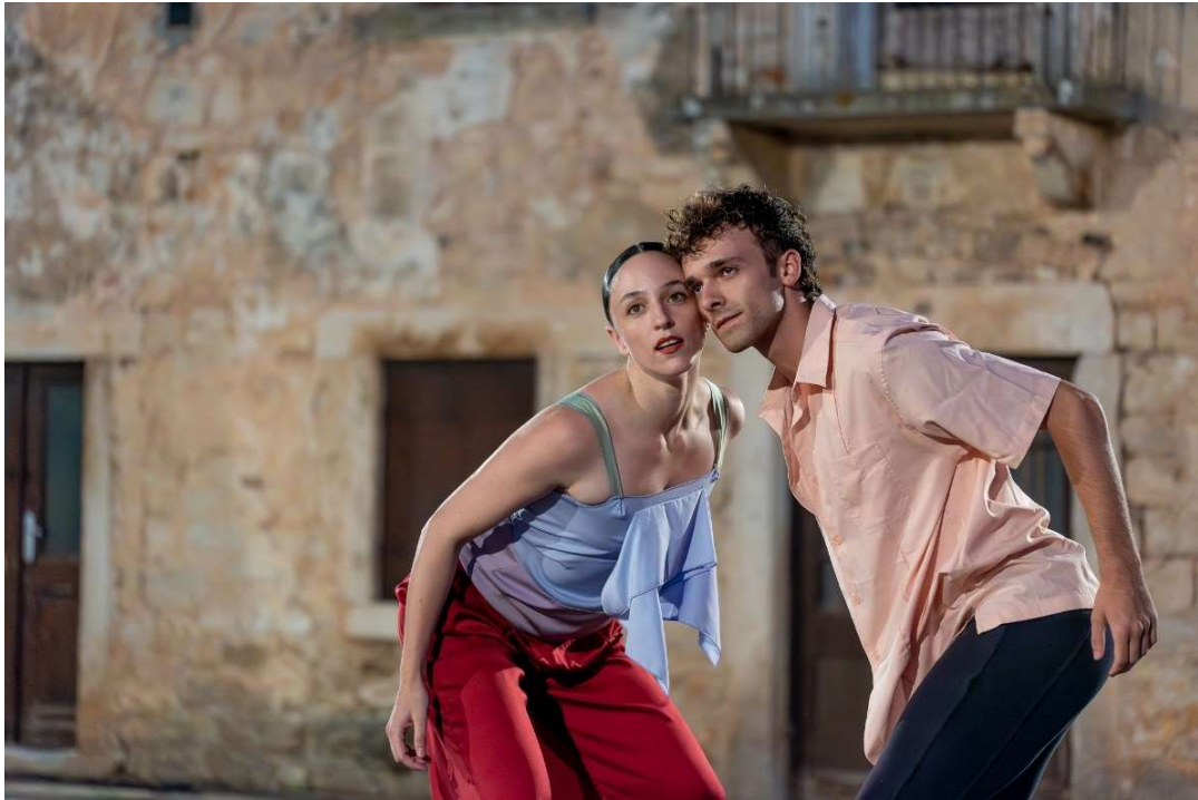
(Predstava Otra Carmen (Entrée a dos) )

Ovaj festival, koji uživa ugled cijenjene kvalitete, kako u Hrvatskoj, tako i u inozemstvu, koristi svoje marketinške i komunikacijske alate kako bi privukao veliki broj stranih posjetitelja, koji dolaskom postaju turisti. Prema statistikama, festival godišnje privlači oko 4.000 gledatelja, brojka koja kontinuirano raste.