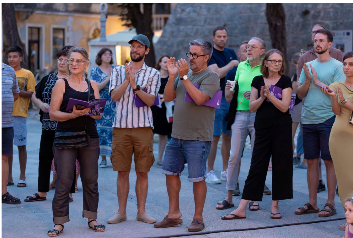
(publika 25. festivala)

Festivalske izvedbe nisu samo premještene u Savičentu; one se duboko integriraju s prostorom, poviješću i arhitekturom cijelog mjesta, stvarajući tako potpuno jedinstveno i lokalizirano iskustvo. Smještajući pojedine predstave na trg, u povijesnu ložu ili Kaštel Morosini – Grimani, publika ne prati samo izvedbu, već ulazi u priču koja se odvija u srcu grada, doživljavajući svaku scenu kroz prizmu lokalne kulture i tradiciju. Ovaj jedinstveni ambijent, omogućava gledateljima uzvišeno iskustvo pojedine izvedbe, dok istovremeno istražuju povijest i identitet Svetvinčenta.