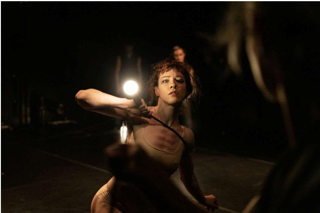
(Predstava Tamo, gdje sve duše idu )

our hydrological need of cosmic lines i ZPA s predstavom Tamo, gdje sve duše idu istaknule su se kao vodeće izvedbe ovogodišnjeg programa. Istaknuti u najavama, pred publikom su u potpunosti opravdali i štoviše nadmašili očekivanja, koja ih je nagradila gromoglasnim pljeskom u punom gledalištu. I ove godine, program festivala ponosno odražava stilska strujanja suvremene umjetnosti u Europi, ali i činjenicu da je ples širok i umjetnički uzbudljiv pojam. Uz brojne umjetničke kolektive, festival je uspješno okupio raznoliku publiku, uključujući brojne plesne umjetnike, pedagoge, stručnjake, kritičare, te ljubitelje plesa, i one koji će to tek postati.