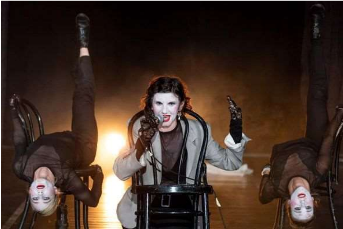
(Predstava Cabaret Fatal u MPC-u)

Iz sezone u sezonu, unatoč skromnim financijskim sredstvima, naš festival ne samo da se uspješno održava, već i sustavno ostvaruje svoje ambiciozne ciljeve. U srpnju ove tekuće godine još jednom smo dokazali da je Festival plesa i neverbalnog kazališta jedinstvena manifestacija na kulturnom kalendaru, istaknuta i prepoznatljiva među ostalim festivalskim događanjima. Sinergija turističkog potencijala idiličnog Svetvinčenta sa suvremenim plesnim izričajem stvara uistinu unikatno iskustvo za sve uključene.