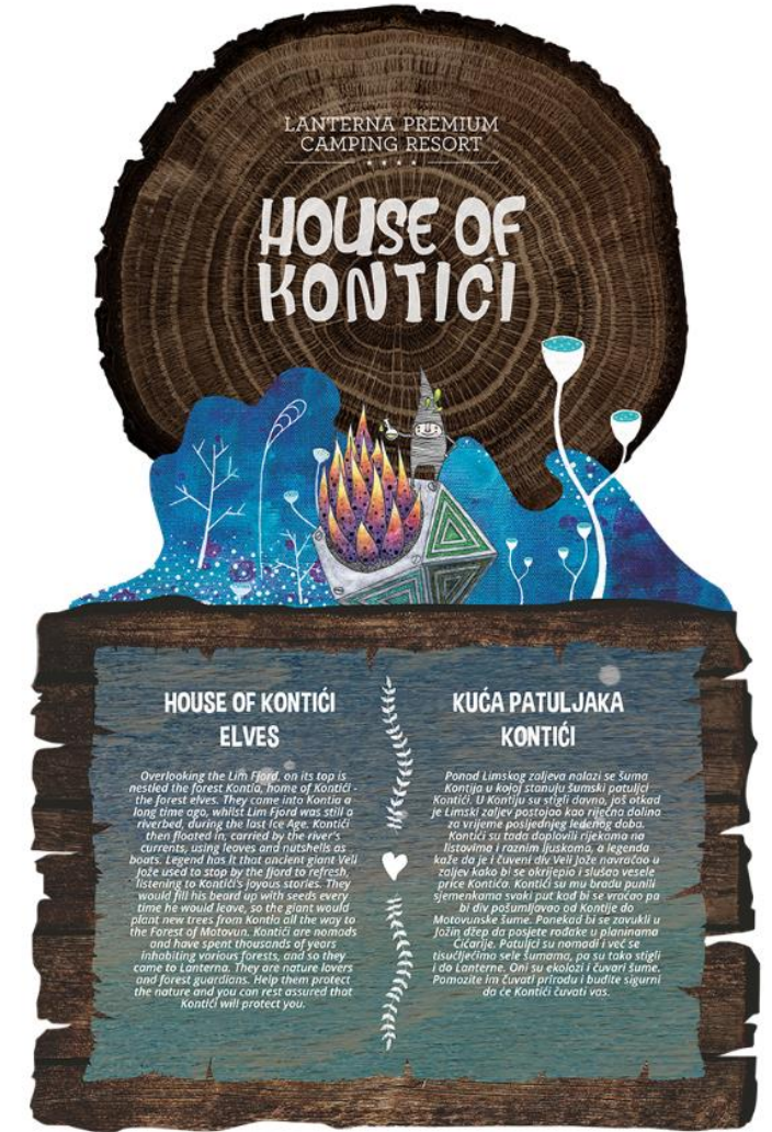
Kućica patuljaka Kontići nalazi se na istoimenoj parceli i ukopana je u tlo