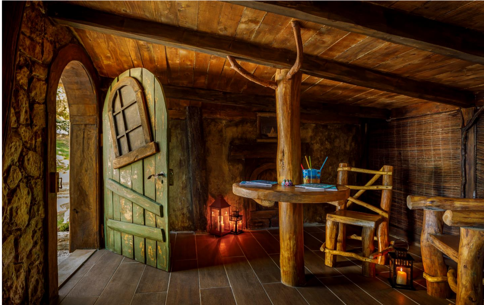
Unutrašnjost kućice u tlu odlična je kulisa za dječju zabavu (gore); tabla ispred kućice goste upoznaje s Kontićima i njihovom misijom očuvanja okoliša (desno)